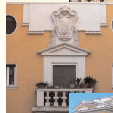
Ripristino facciate palazzi storici del '900