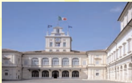
Cortile interno Quirinale