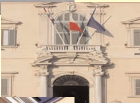
Prospetto facciata Quirinale