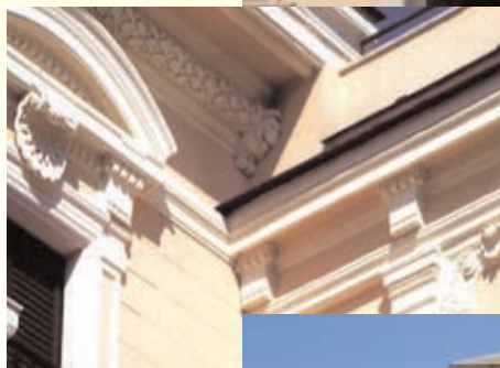
Recupero Modanature e Fregi